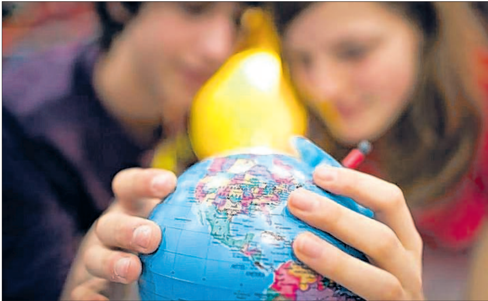
Lernen zum Anfassen: Mit den richtigen Lernhilfen geht auch ungeliebter Stoff in den Kopf.

Für alle Französisch-Muffel bringt das „La Grammaire Par Le Jeu“ (Langenscheidt) vielleicht ein wenig Abwechslung. Hier werden Spiele mit französischer Grammatik verknüpft, die Lernende aller Sprachniveaus verwenden können. Gleich zwei Sprachen auf einmal, nämlich Englisch